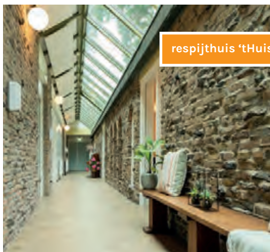
respijthuis 'tHuis Lioba